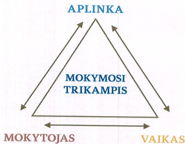
9 lentelė. Pagrindiniai M. Montessori pedagoginės metodikos komponentai